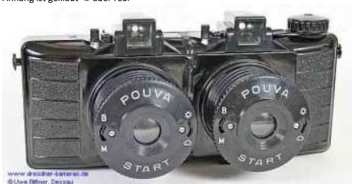
pouva_stereo_10_ub.jpg (28.07 KiB) 3925-mal betrachtet