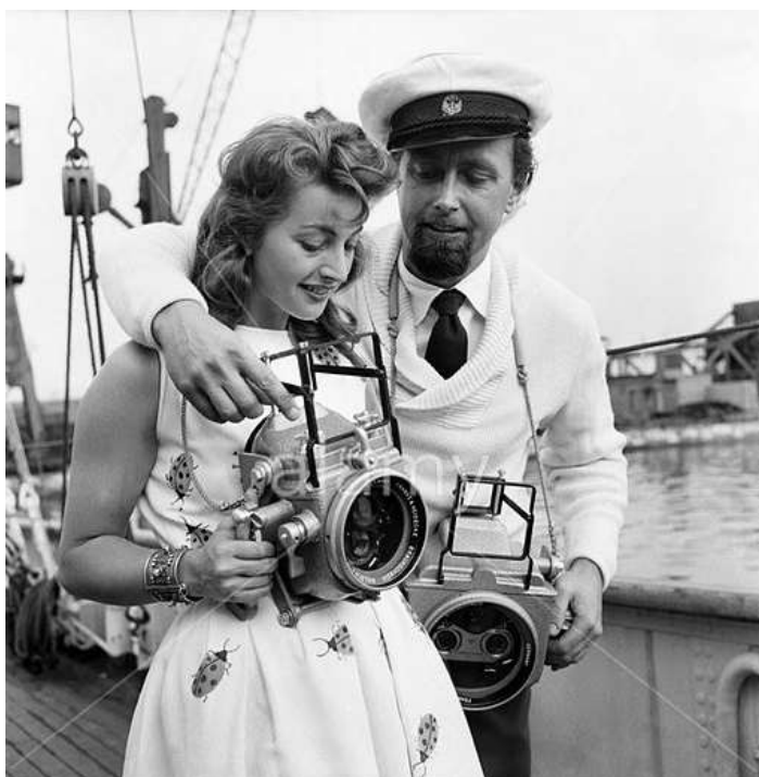
hans und lotte Hass.jpg (61.33 KiB) 311-mal betrachtet

beim Bilder durchsehen fiel mir dieses Bild auf und ich hab mich wieder an diesen Tread erinnert. Da hat H. Hass ja seine Stereo Rolleiflex noch in der Hand. Soll aus 1966 stammen.