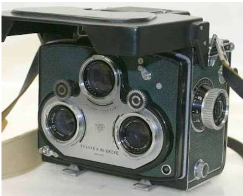
Stereokamera 4.jpg (43.31 KiB) 3943-mal betrachtet

2014 ist es 60 Jahre her daß die Rolleimarin zum ersten mal verkauft wurde. Dazu plane ich eine Ausstellung in Zusammenarbeit mit dem Aquazoo in Düsseldorf.